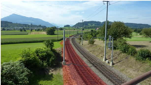
Visualisierung des 2. Gleises (rot). Blick von Cham in Fahrtrichtung Rotkreuz, rechts Golfplatz Holzhäusern.