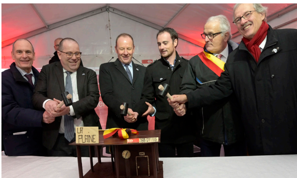
Symboliquement, une marmite représentant l'ancienne gare de La Plaine a été offerte en dégustation !