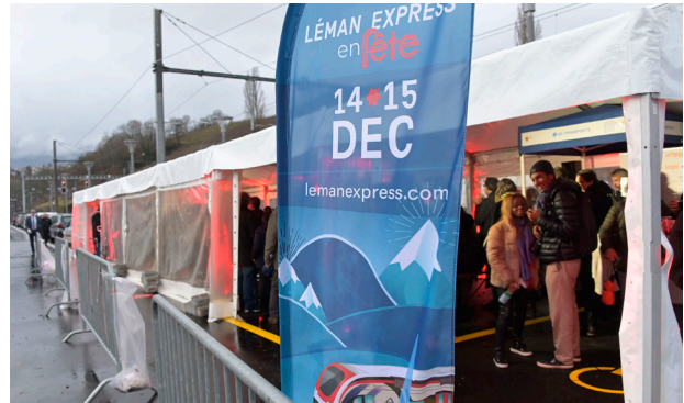
Quelque 150 personnes étaient présentes pour l'inauguration de la gare de La Plaine.