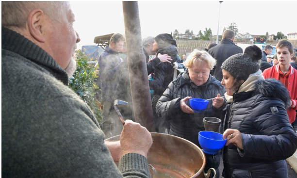
Les autorités de Russin ont offert la traditionnelle soupe aux légumes à la population lors de l'inauguration de la gare. Une soixantaine de personnes étaient présentes.