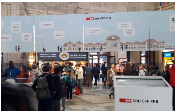
La foule en transit dans le hall principal était très curieuse de découvrir le futur visage de sa gare.

Les diverses étapes de chantier, défis et mesures mises en place pour diminuer les impacts (accès, nuisances, durée) sur les clients, les riverains et la population lausannoise ont pu être présentés et expliqués à un large public. Parmi celui-ci, des pendulaires, des jeunes en formation, des retraités et des touristes.