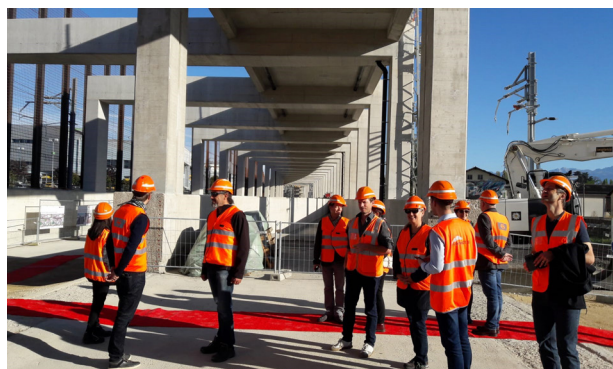
Les visiteurs ont pu se rendre dans la galerie du viaduc, à proximité immédiate du trafic ferroviaire et ce, en toute sécurité.