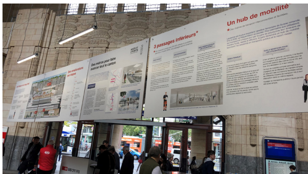
L'exposition présentait également les projets connexes des métros et de la place de la gare menés par nos partenaires, le Canton de Vaud et la Ville de Lausanne.

Un supplément 24heures dédié à la gare de Lausanne a été réalisé en complément à cette exposition. Outre les abonnés à ce journal, quelque 11'000 exemplaires ont été distribués en gare de Lausanne et Renens. Les voyageurs ont ainsi pu prendre la mesure de l'ampleur du chantier, avec des mises en service par étape et un fort impact au niveau régional et national. Tous ces aménagements permettront à terme d'augmenter la capacité de la ligne Lausanne-Genève et la cadence du RER Vaud Cully-Cossonay.