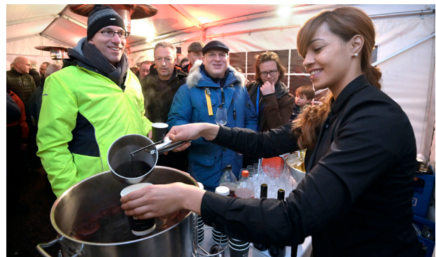
Les habitantes et habitants de la commune de Satigny sont venus en nombre fêter leur gare, dont les quais ont été allongés. Environ 75 personnes se sont déplacées, malgré des conditions météo peu favorables.