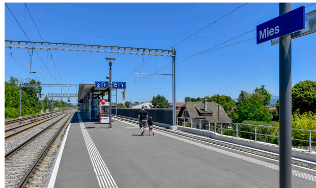
Les haltes de Mies et de Chambésy, qui sont en service depuis juin 2018, représentent chacune un point de croisement pour le réseau Léman Express.

Grâce à ces réalisations, ainsi qu'à l'inauguration de la nouvelle gare de Lancy-Pont-Rouge, les clients ont pu profiter depuis le début du mois de juin 2018 de trains à la cadence 15 min sur toute la ligne régionale Coppet – Genève – Lancy-Pont-Rouge en heure de pointe. Cette amélioration a rapidement eu un vif succès et a été adoptée par les clients et habitants de cette région.