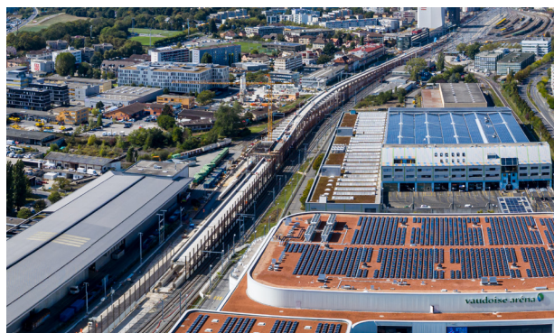
Vue aérienne du chantier du saut-de-mouton

Quelque 600 personnes, dont des familles, riverains et curieux, se sont déplacées le 12 octobre 2019 aux visites publiques du chantier du saut-de-mouton (viaduc ferroviaire) entre Prilly-Malley et Renens organisées par les CFF. Il leur a été proposé de se rendre à l'intérieur de ce colossal ouvrage en construction et d'échanger avec les responsables du projet. Le saut-de-mouton est un des aménagements nécessaires pour augmenter la capacité du trafic ferroviaire entre Lausanne et Genève et les cadences du trafic régional. Outre une longueur de 1175 mètres, le viaduc affiche une hauteur de neuf mètres à son point culminant. Ses travaux ont débuté en novembre 2018 et doivent prendre fin en décembre 2021. Montant de l'investissement : 112 millions de francs.