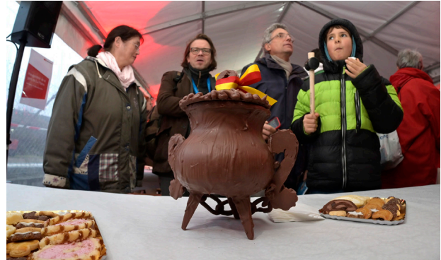
Les habitantes et habitants de Dardagny ont également été mis à contribution pour casser et savourer des marmites.