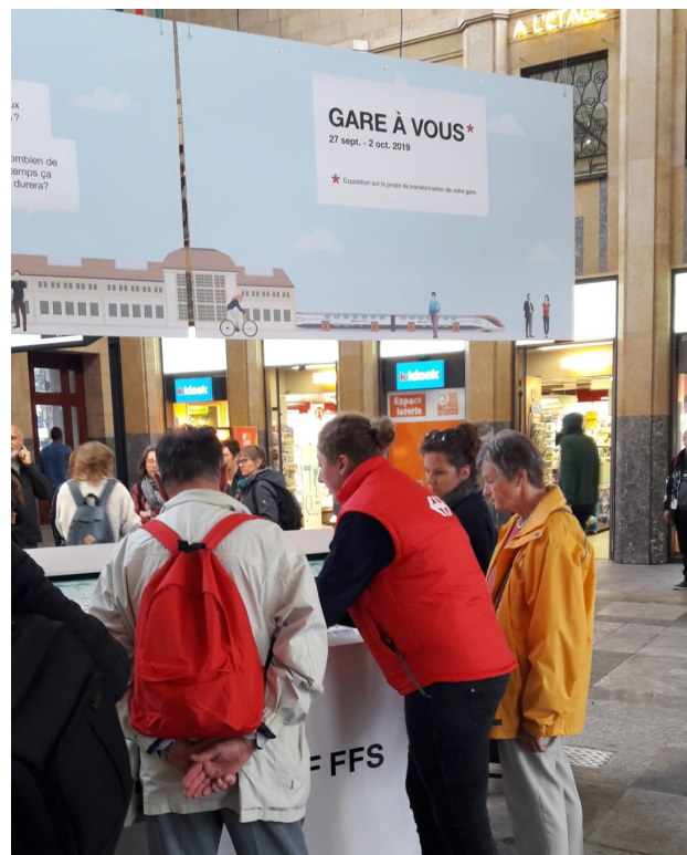
La table interactive a permis d'illustrer de façon vivante les différentes améliorations à venir.