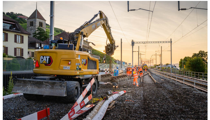
Gleiserneuerung im Bahnhof Twann.

Parallel dazu werden die Arbeiten am Bahnhof Twann und in Kleintwann bis zum Sommer 2024 fortgesetzt. Den umgebauten Bahnhof können Sie ab der Inbetriebnahme im Mai 2024 erkunden. Eine zweite Bauphase ist in Twann nach der Inbetriebnahme des Tunnels mit dem Abbruch des Bahnhofsgebäudes geplant, an dessen Stelle eine Zugangsrampe zur dorfseitigen Unterführung umgesetzt wird.