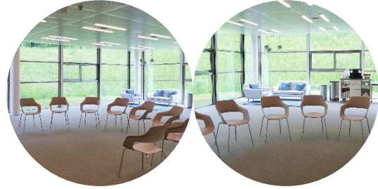
Salle des innovations