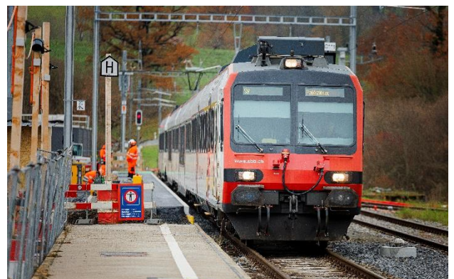
Un train en gare de Châtillens durant les travaux en 2024.

Les premiers travaux transformeront le visage de la gare d'Avenches, dès le printemps 2025 avec la construction d'un nouveau passage inférieur, le remplacement du quai central par un nouveau quai et le rehaussement de l'actuel quai 1. La suite des travaux d'automatisation du tronçon entre Payerne et Kerzers sont également lancés cette année, notamment avec la construction d'un nouveau bâtiment de service à Avenches.